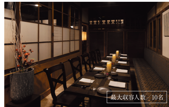
最大収容人数 / 10名