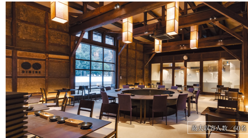
最大収容人数 / 60名

酒造場の心臓部ともいえる発酵蔵をダイニングへ。 太い梁や無数の柱、褐色にそまった土壁、丹波たたきの土間など至る所に、坂作りの命ともいえる麴を風雪から守り育ててきた歴史が息づいています。