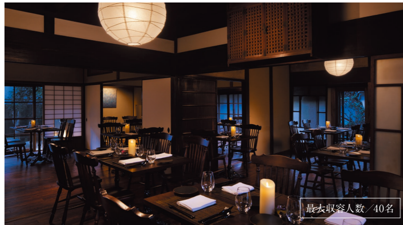
最大収容人数 / 40名

ダイニングがある建物は明治期に建てられた元銀行経営者の住居。 虫籠窓や荒格子・細格子、摺り上げ大戸など、篠山城下のデザイン要素と洋風のガラス戸が混ざり合うモダンな空間。